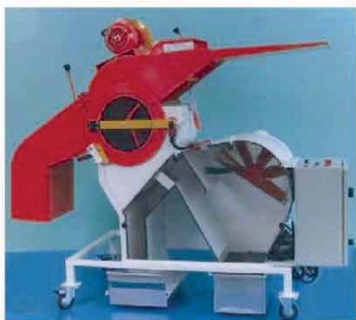
TYPE 350 C