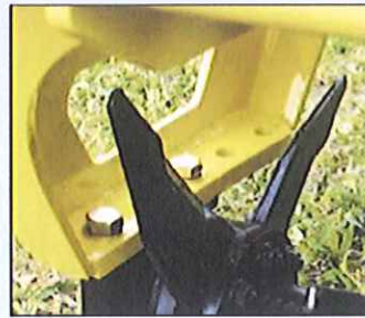
Ajustement manuel du Rouleau