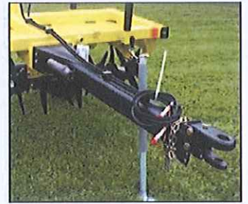
Flèche d'attelage sur version trainée