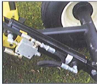
Valve de contrepression Version semi-porté