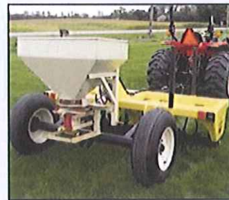
Nouveauté : Semoir attelé