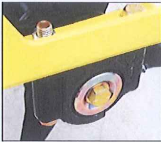
50mm roulement oscillant